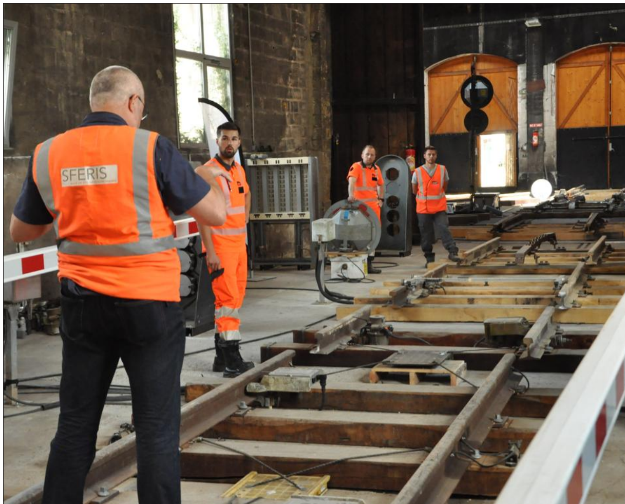
■ Le centre dispose de différents ateliers techniques retraçant l'ensemble du parcours d'un train.

Soutenue à hauteur de 50 000 € par le Grand Autunois-Morvan, la société a créé ces derniers mois des salles de formation théorique attenantes au